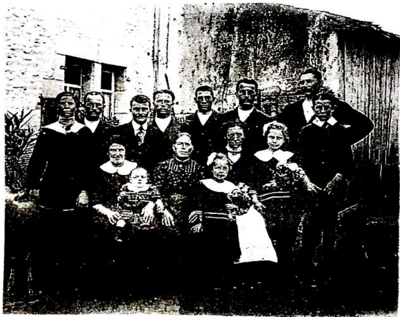
En toile de fond nous retrouvons la façade de la maison N° 18 place du Magnificat Si vous reconnaissez certaines personnes merci de nous le communiquer