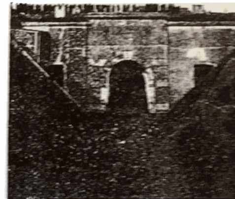
Poterne de contrescarpe. Le 11 août 1914, reddition du fort d'Evernée

- Le 11 août, les bombardements allemands reprennent de plus belle. Le fort agonise et n'est plus en mesure de riposter. Les flammes s'infiltrèrent dans les coupoles brûlant les artilleurs. Avec l'énergie du désespoir, un petit groupe d'hommes se risque à une ultime tentative pour rejoindre le poste d'observation du clocher de Tignée, mais en vain. L'un d'eux, à peine dehors, est tué et le groupe se replie. L'atmosphère à l'intérieur devient de plus en plus irrespirable au point que les occupants sont menacés d'asphyxie. Vers midi, un troisième parlementaire allemand se présente et prie le commandant de capituler. Après avoir consulté ses officiers et soucieux de protéger la vie de ses soldats, le commandant décide de rendre le fort. Ainsi, la garnison entière sera désormais prisonnière avec tous les honneurs militaires. L'officier allemand ne manquera pas de rendre hommage aux vaillants défenseurs du fort d'Evernée, et en particulier à leur commandant qu'il tente de reconforter par ces simples paroles : « Vous êtes un brave soldat ».